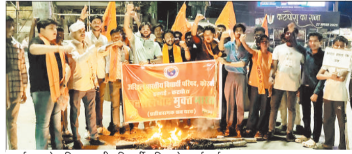
प्रदर्शन करते अखिल भारतीय विद्यार्थी परिषद के कार्यकर्ता।

अखिल भारतीय विद्यार्थी परिषद के कार्यकर्ताओं ने छत्तीसगढ़ को नक्सल मुक्त बनाने की दिशा में एक बड़ा कदम उठाते हुए कटघोरा में जोरदार विरोध प्रदर्शन किया। इस दौरान कार्यकर्ताओं ने नक्सलवाद का पुतला दहन कर अपनी नाराजगी जाहिर की और राष्ट्रहित में एकजुट होने का संदेश दिया। अभाविप कार्यकर्ताओं ने कटघोरा के आत्मानंद स्कूल परिसर से शहीद वीर नारायण चौक तक विरोध रैली निकाली और नक्सलवाद का पुतला फूँका। कार्यकर्ताओं ने प्रदेश सरकार और भारत सरकार द्वारा छत्तीसगढ़ को नक्सल मुक्त घोषित करने के संकल्प का स्वागत किया। परिषद के सदस्यों ने युवाओं के बीच बढ़ते अर्बन नक्सल के