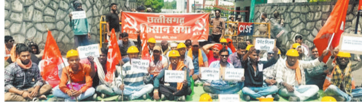
प्रदर्शन करते भूविस्थापित।