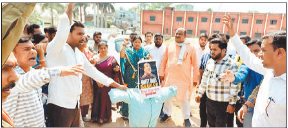
पुतला दहन करते कांग्रेसी।