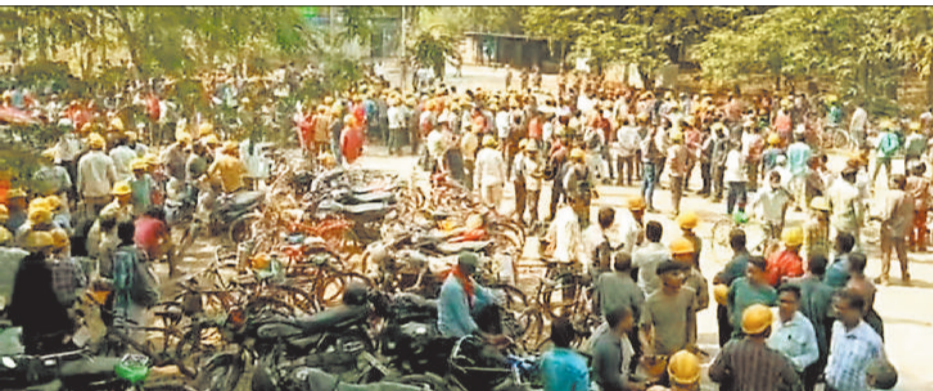
धरना प्रदर्शन कर चक्काजाम करते मजदूर।